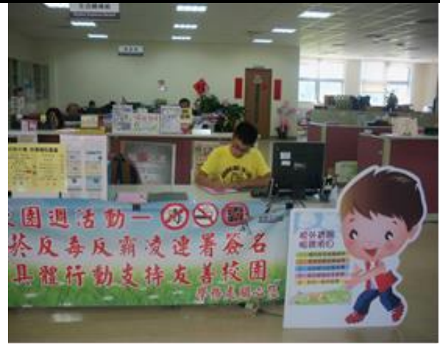
活動名稱：「友善建康校園週」「拒菸反毒反霸凌」連署簽名活動-簽名台佈置及學生簽名 時間：105 年 9 月 12 日-9 月 28 日 地點：全校各處室 辦理單位：生活輔導組