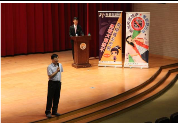
活動名稱：「友善建康校園週」「拒菸反毒反霸凌」連署簽名活動-學務長說明友善校園週 時間：105 年 9 月 12 日-9 月 28 日 地點：全校各處室 辦理單位：生活輔導組