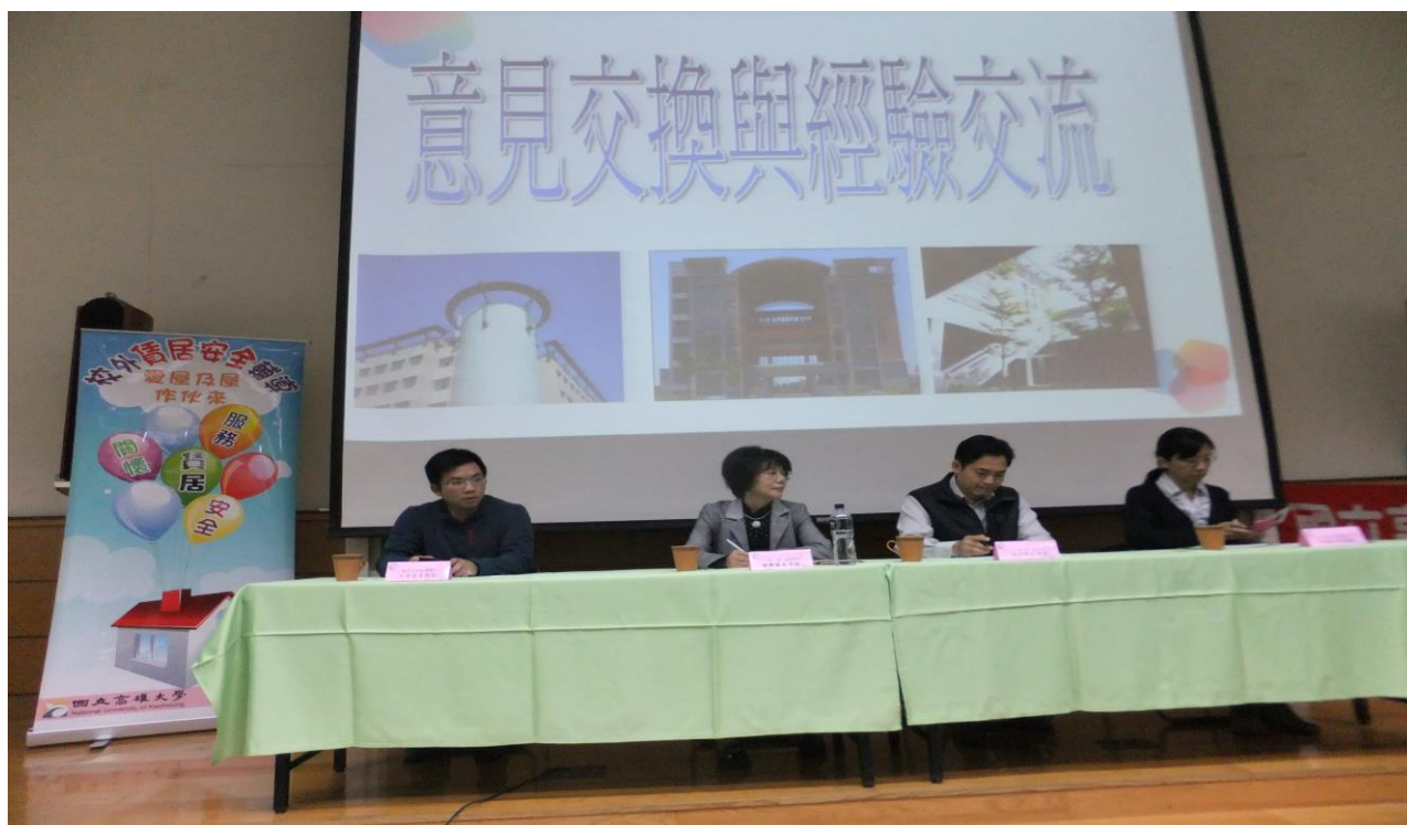
活動名稱：103 學年度房東座談會－意見交換與經驗交流 時間：103 年 12 月 8 日 地點：圖資館多媒體教室 辦理單位：生活輔導組