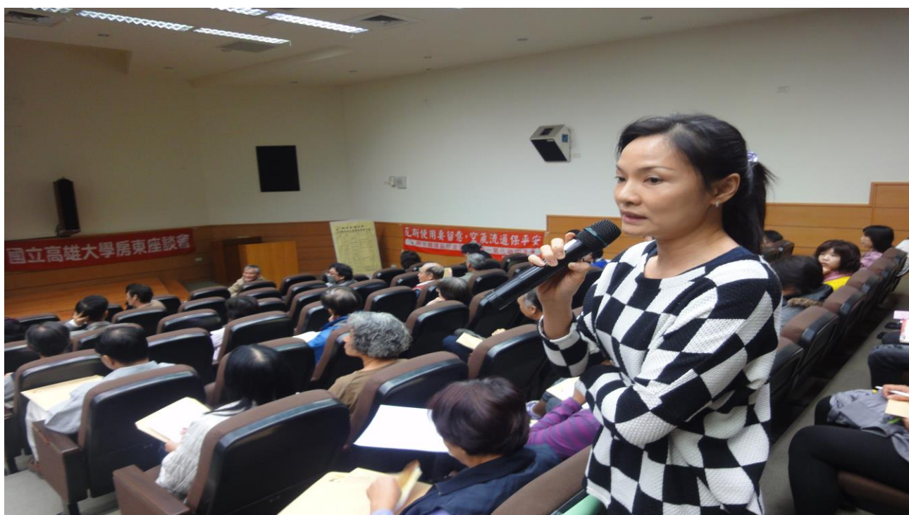
活動名稱：103 學年度房東座談會－意見交換與經驗交流 時間：103 年 12 月 8 日 地點：圖資館多媒體教室 辦理單位：生活輔導組